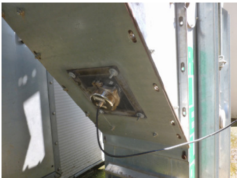
Sensor am Trocknereinlauf und -auslauf