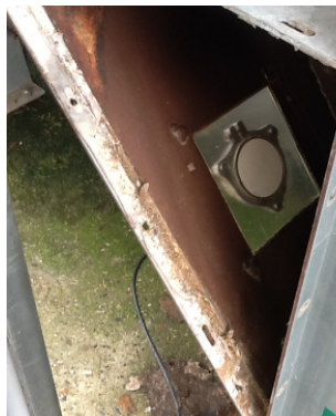
Messung durch Plexiglasscheibe